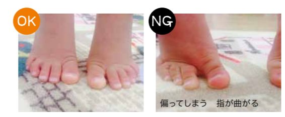
※指も真っすぐつま先立ちができますか？