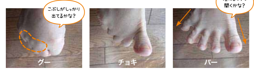
※講演会では3人に1人のお子さんができませんでした。