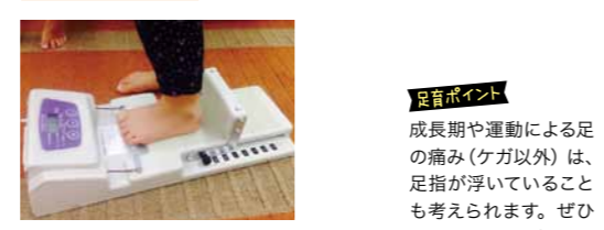
※小学生からチャレンジできます。

足指ポイント 成長期や運動による足の痛み(ケガ以外)は、足指が浮いていることも考えられます。ぜひチェックしてください。