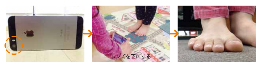
※ポイントは正面からカメラを地面につけて撮影。